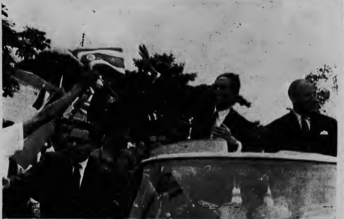
SAN JOSE, COSTA RICA--Presidente mexicano Gustavo Diaz Ordaz ta saluda e multitud mientras e ta hasiendo un paseo cu e presidente costaricense Francisco Orlich despues di su yegada aki. E mandatario mexicano ta riba un gira pa Centroamerica.

E departamento di comercio a informa cu e exportadornan acredita lo hanja cuotanan individual